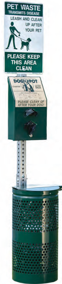
Dogipot Station Medidas 198 x 30 $640