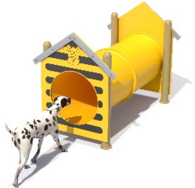
Doggie Tunnel Medidas 210x130x155