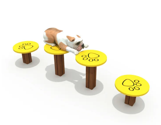
Doggie Steps 4 Steps Medidas 215x40x45 $462