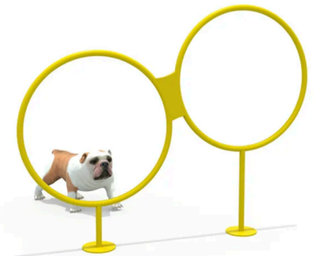
2 Ring Jumper Medidas 80x80 $235