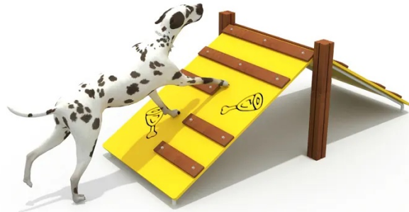
King of the Hill without Rest Stop Medidas 370x120x90 $1614